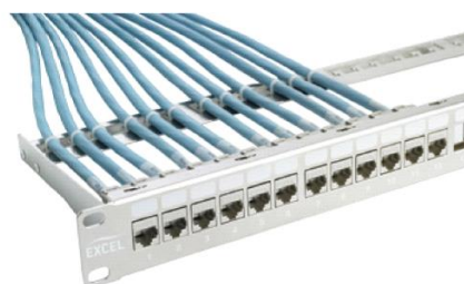
D. Moduły Keystone zamontowane w chromowym patch panelu - numer kat. 100-028