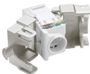
C. Widok z tyłu modułu Keystone z nałożoną nasadką