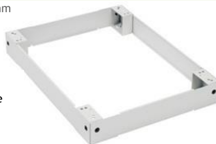
Cokół 100mm - poglądowe zdjęcie